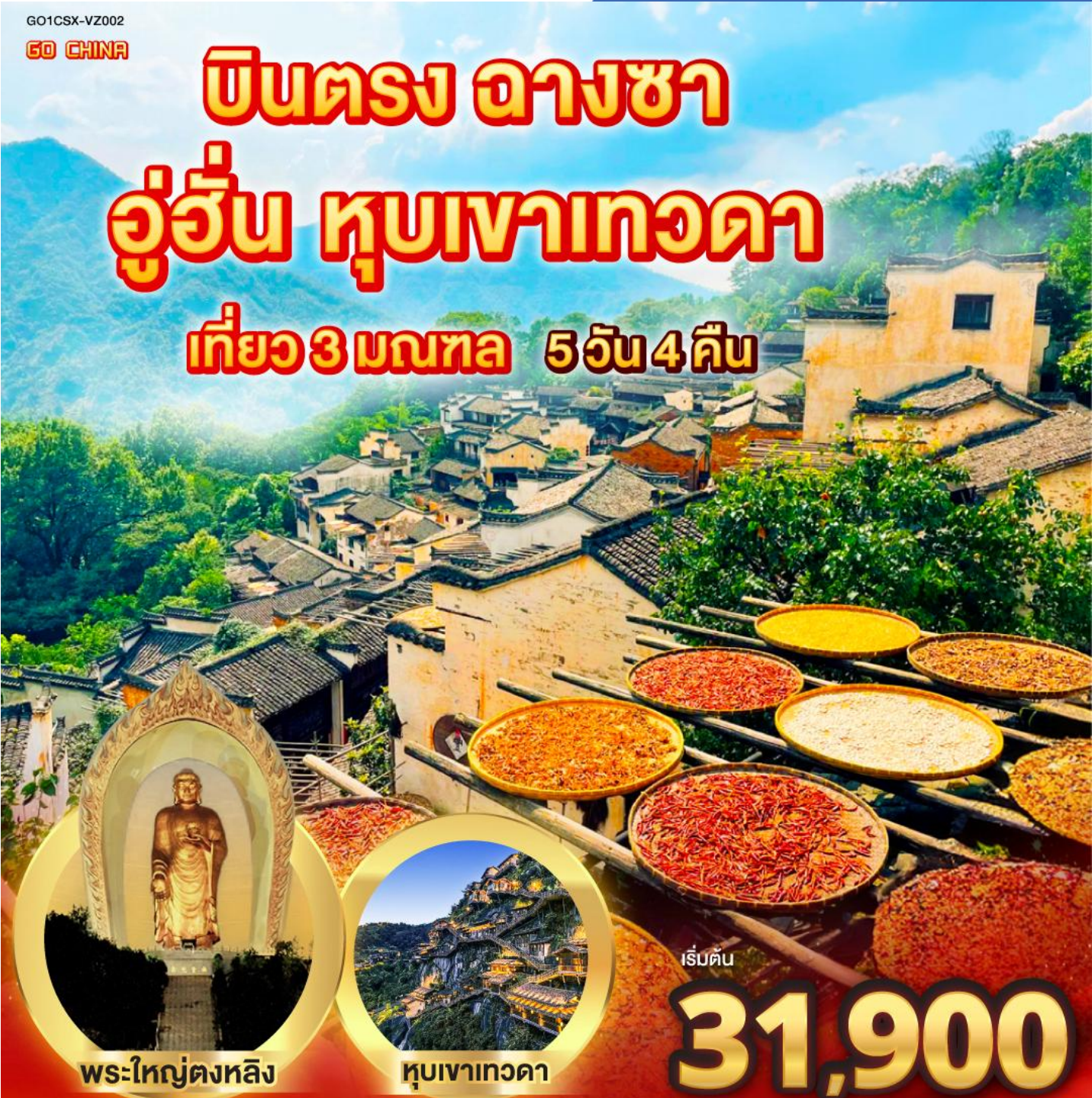
พระใหญ่ตงหลิง