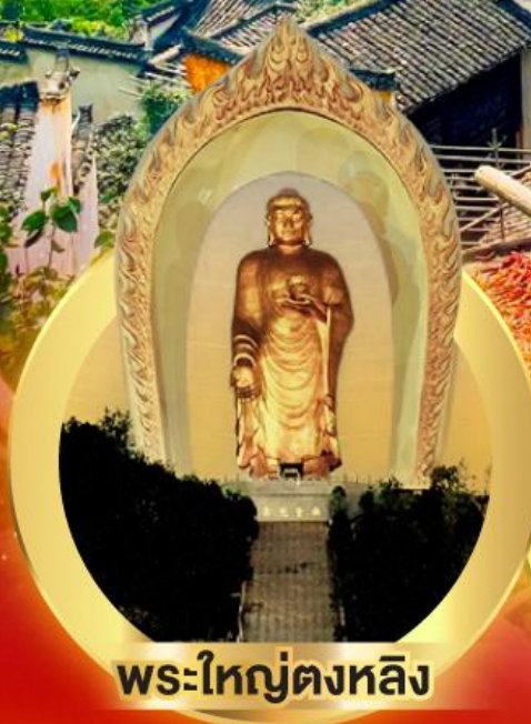
พระใหญ่ตงหลิง