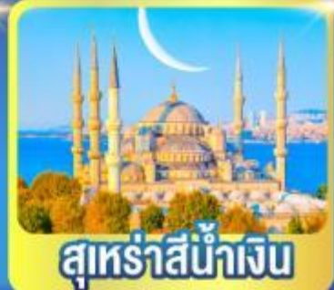
สุเหร่าสีน้ำเงิน