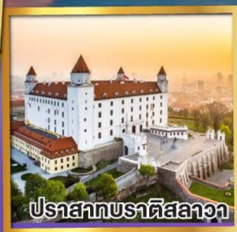
ปราสาทบราติสลาวา