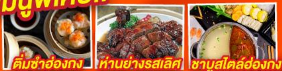
ติ่มซำฮ่องกง