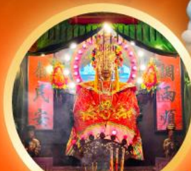
วัดเจ้าแม่กิมกิมทิว ของพระโศกสา ความมีสิ่ง เดิมทางไกล สุขภาพแข็งแรง