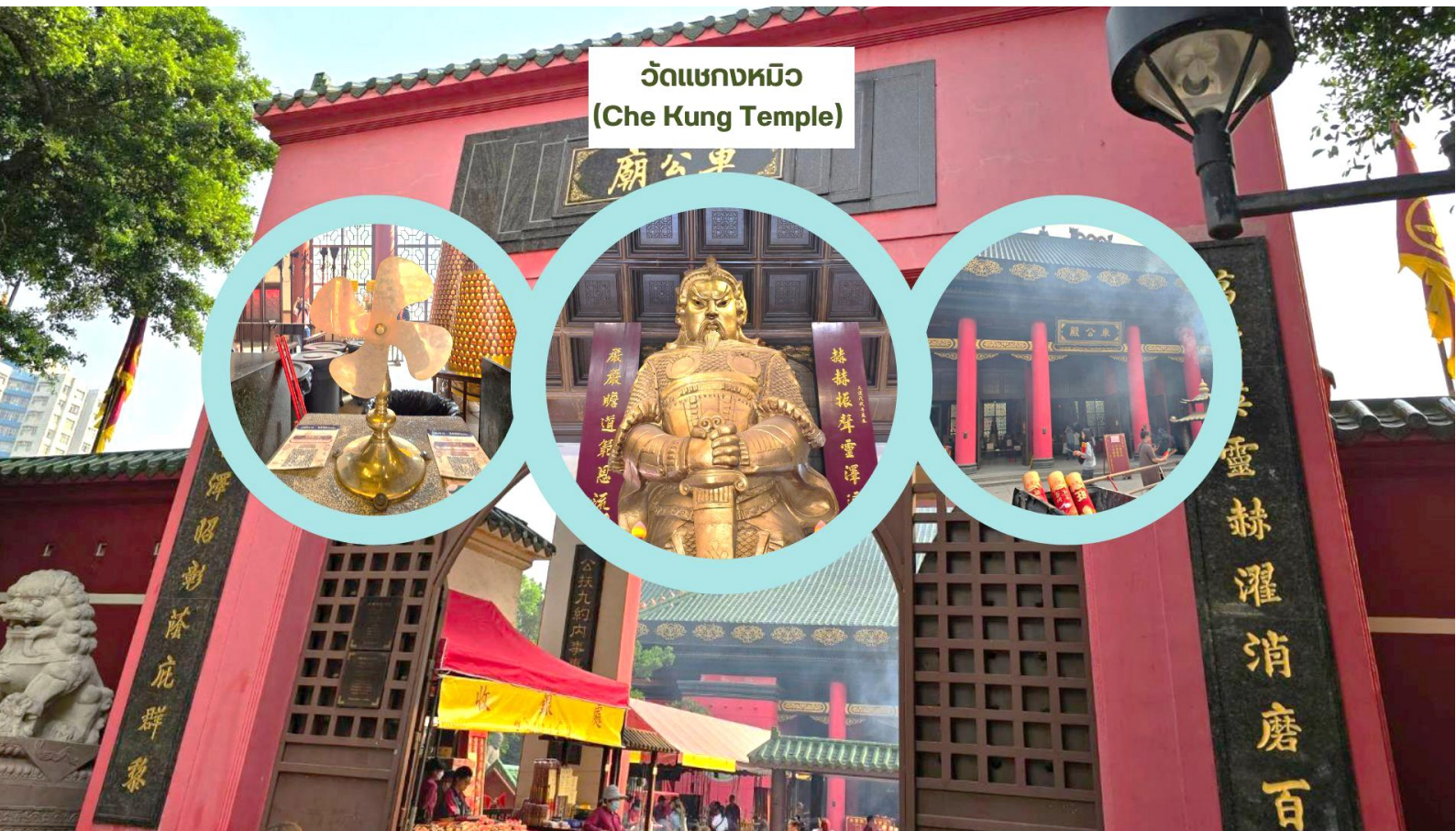
วัดแขกหมิว (Che Kung Temple)

จากนั้นนำท่านเดินทางสู่ วัดแขกหมิว หรือ วัดกังหัน (Che Kung Temple) ขอพรเรื่องการเดินทางปลอดภัย สุขภาพแข็งแรง โชคลาภ และเงินทอง วัดตั้งฮ่องกงที่ตั้งมาถึงเมืองไทย เป็นวัดที่มีประวัติศาสตร์ยาวนานกว่า 300 ปี ภายในวัดมีรูปปั้นสีทองเหลืองอร่าม ตั้งตระหง่านทั้งซ้ายและขวา เป็นวัดศักดิ์สิทธิ์ที่มีความเชื่อในเรื่องกังหันลม โดยความหมายของใบพัดทั้ง 4 คือ เดินทางปลอดภัย อายุยืนยาว เงินทองไหลมาเทมา และสมปรารถนาทุกประการ หากหมุนกังหันตามเข็มนาฬิกา 3 รอบ จะพัดพาเอาสิ่งไม่ดีออกชีวิต และนำสิ่งดีๆ เข้ามาแทน