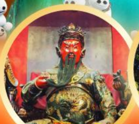
เทพเจ้ากวนอู วัดกวนไท ของพระเทพเจ้ากวนอู ความซื่อสัตย์ เมตตาสูง สุขเกษม