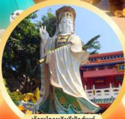
เจ้าแม่กวนอิมรับพลส่วย ของพระด้านสุขภาพดี อายุยืนยาว