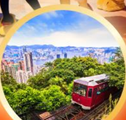
วัดคอเรียพิก