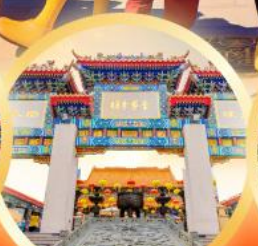
วัดหวังคำเซียน ของพระสุขภาพ ความรัก