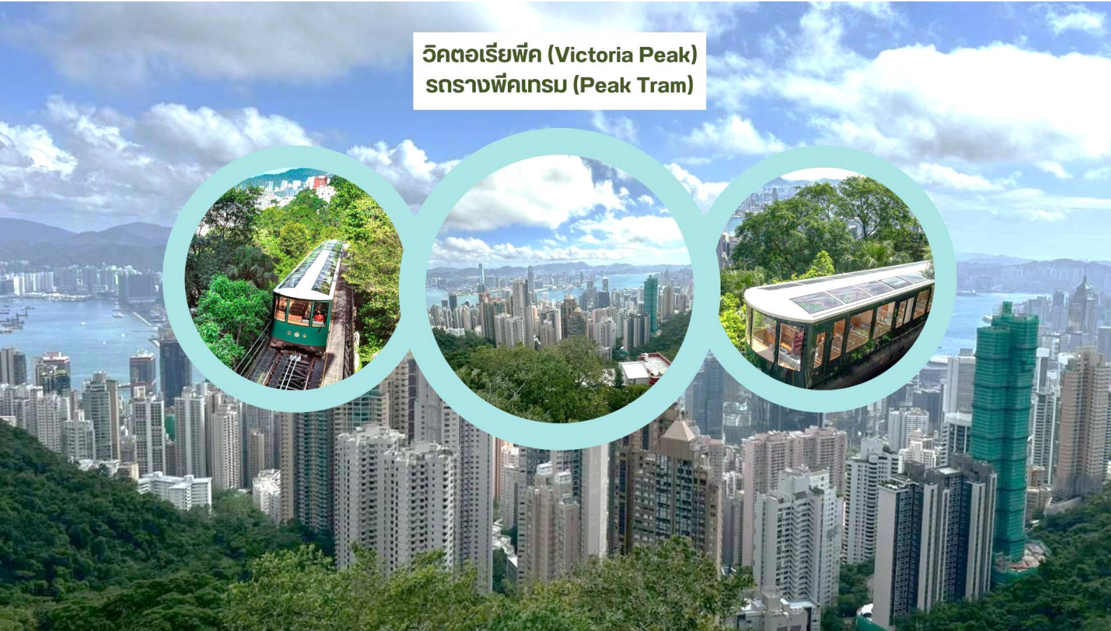
วิกตอเรียพีค (Victoria Peak) รถรางพีคเทรม (Peak Tram)

เช้า รับประทานอาหารเช้า ณ ภัตตาคาร บริการท่านด้วยเมนูติ่มซำฮ่องกง (มื้อที่ 3)