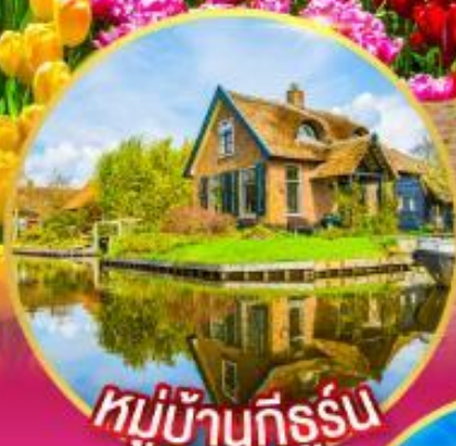
หมู่บ้านที่รูรัน