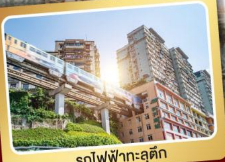
รถไฟฟ้าทะลุตึก