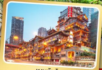
หงหย่าต้ง

แบบพิเศษ สุทธิที่มีอโพลองซึ่ง,เปิดปีกถึง