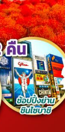
ช้อปปิ้งย่าน ชินโซบาสึ