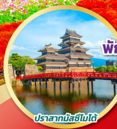
ปราสาทมัตสึชิมะโต