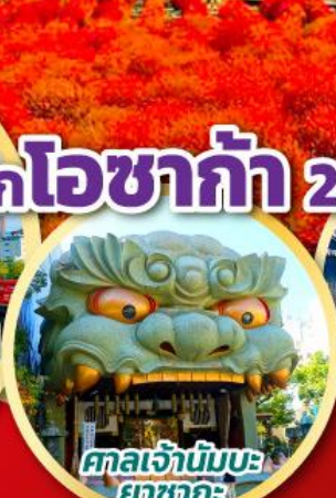
ศาลเจ้าบึงบอ ยาคะ