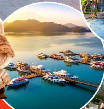
ทะเลสาบสุริยขึ้นจันทรา