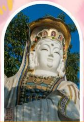
ริพลัสเบย์ รับพลังงานดี เสริมพลังดวงจัญ