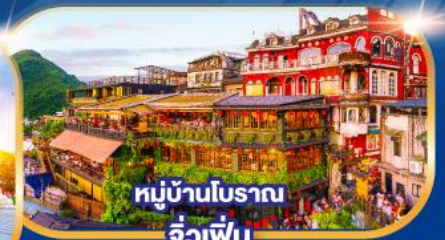
หมู่บ้านโบราณ จิวเฟิ่น