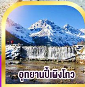
อุทยานปี่เผิงโก