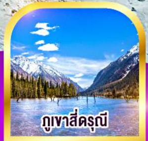
ภูเขาสัตรุณี