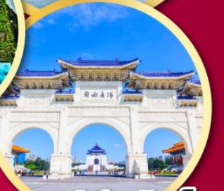
อนุสรณ์เจียงไคเช็ค