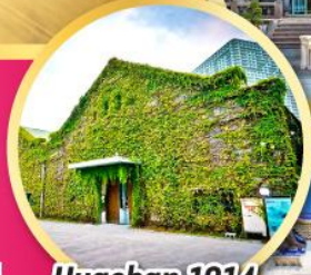
Huashan 1914 Creative Park