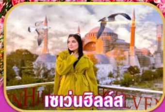
เซเว่นอิลลัล