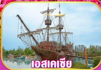
เอสเคเซีย