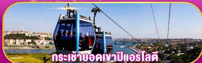
กระเช้ายอดเขาปีแอร์โลตี

ชมดอกไม้บานที่สวนอัมสเตอร์ดัม พร้อมเข้าชม “ปราสาทเทพนิยายซาโงวาแห่งเอสเคเซีย” และ ชมวิวบนยอดเขาปีแอร์โลตี