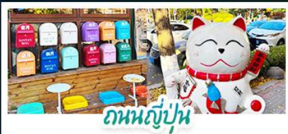
ถนนญี่ปุ่น

ไฮไลท์ ท่าเรือประมง • เวนิสจำลอง ทุ่งหญ้าหุยมตวน • ชายแดนจินกาทาลี