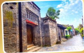
ถนนคนเดินชอยกวางชอยแคบ