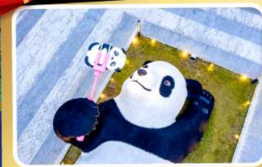
หมีแพนด้าอนเซลฟ์