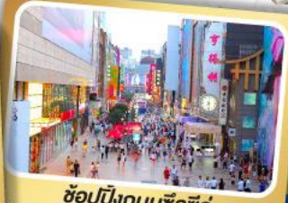
ช้อปปิ้งถนนซิลซิลู่