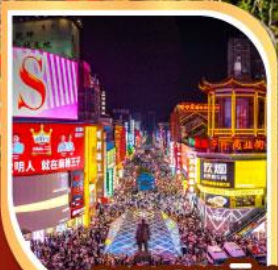
ถนนคนเดิน หวงซิงลู่