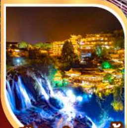
เมืองฝูหลงเจิน