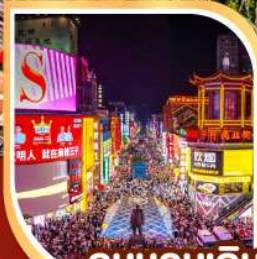
ถนนคนเดิน หวงซิงลู่