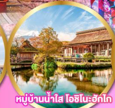
หมู่บ้านน้ำใส โอชิโนะฮักโก