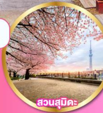
สวนสุมิดะ