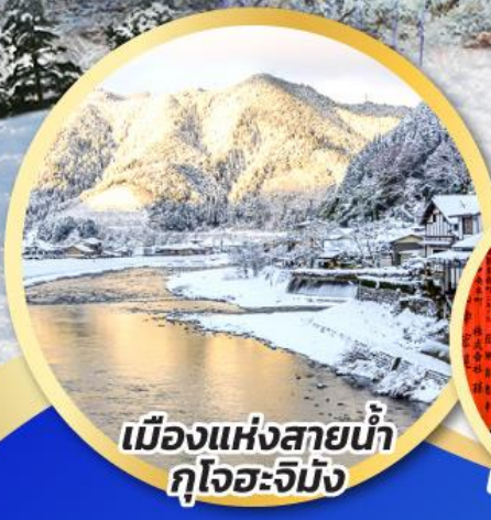
เมืองแห่งสายน้ำ กุโจะจิมัง