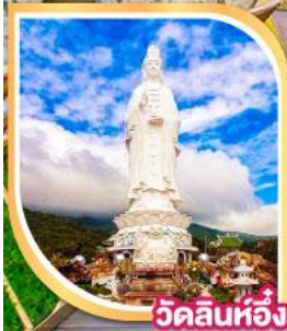
วัดลินห์ฮ็อง