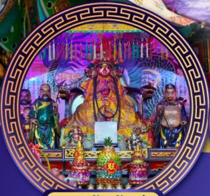
ศาลเจ้าหั่งเจีย