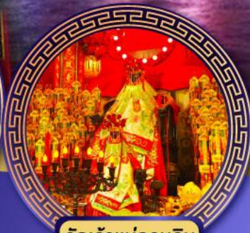
วัดเจ้าแม่กวนอิม ฮองอ่า