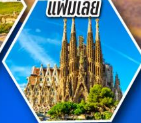
โบสถ์ซากราดา แฟมิลีย