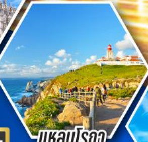
แหลมโรกา