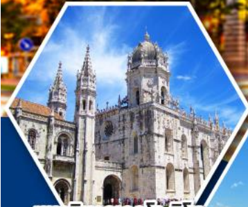
มหาวิหารเจอโรนิโม