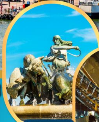
น้ำพุแห่ง ราชินีกเฟออน