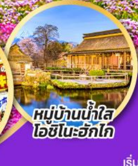
หมู่บ้านน้ำใส โอชิโนะฮักไก