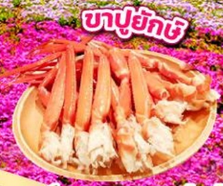
บุนปุยักชิ