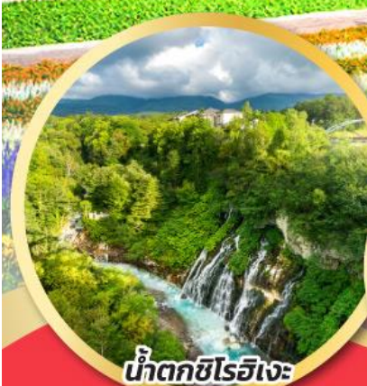
น้ำตกชิโรอิเงะ