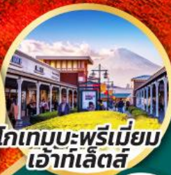
โกเทมบะพรีเมียม เอ้าท์เล็ตส์