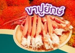
งาปูยักษ์