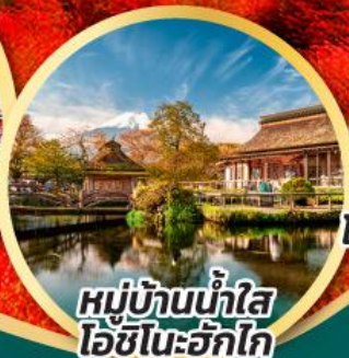
หมู่บ้านน้ำใส โอชิโนะอากิโก