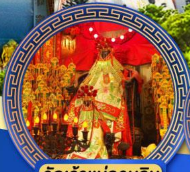
วัดเจ้าแม่กวนอิม ฮ่องอ้อ