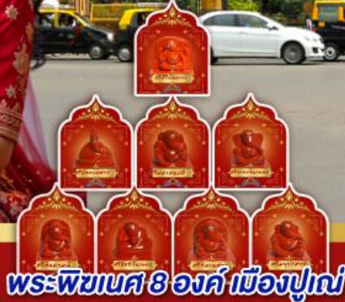
พระพิฆเนศ 8 องค์ เมืองปูเน่