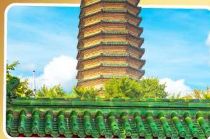
วัดพระเจี๊ยะเก้ว

เมนูพิเศษ เปิดปักกิ่ง, ซามูหม้อไฟ อาหารกวางตุ้ง, อาหารเสวน