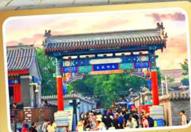
ถนนโบราณหนานหลิวกู่เซียง