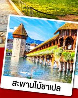
สะพานไม้ซาเปล

11-19 ก.พ. 68 08-16, 15-23 มี.ค. 68 09-17 เม.ย. 68