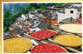
นังกระเช้าขึ้นชมหมู่บ้านหวงหลิง