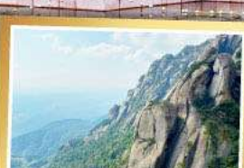
เขาหลงซาน