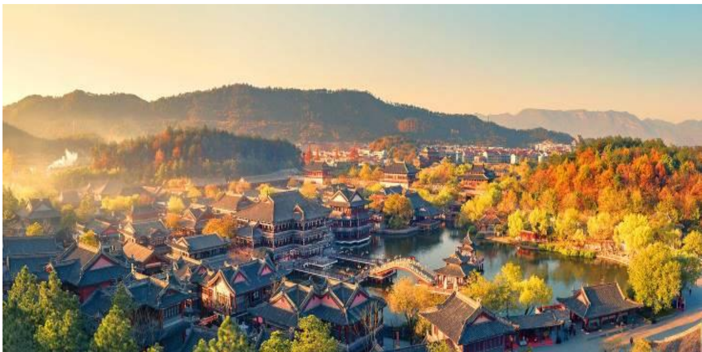
G01HGH-CA002 หังโจว เติ้งเตี้ยน หวงหลิง หุบเขาเทวดาวังเซียนกู่ 6วัน 4คืน โดยสายการบิน AIR CHINA (CA)