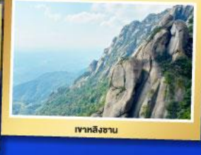
เขาหลงซาน