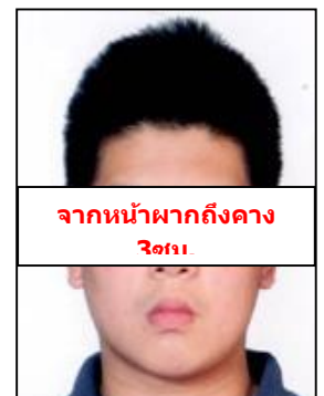
จากหน้าผากถึงคาง 3cm