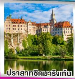
ปราสาทชิกมาริงเก้น