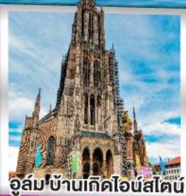
อูล์มบ้านเกิดไอน์สไตน์