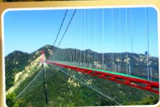
สะพานแขวนอ้ายจ้าย