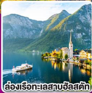
ล่องเรือทะเลสาบอัลสติก

พิเศษ! เมฆูซิสฟองดูว์ เปิดป่ากึ่ง และ ชูปัญญาช