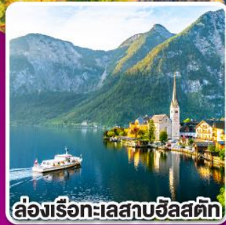
ล่องเรือทะเลสาบอัลสติก

พิเศษ! เมฆูซิสฟองดูว์ เปิดป่าทึบ และ ชูปกูลาช