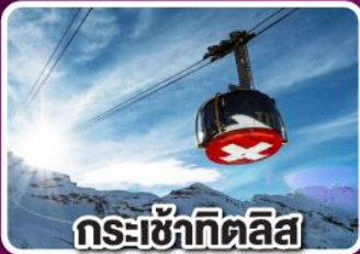
กระเช้าทีตลิส