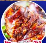
หมูเยอรมัน