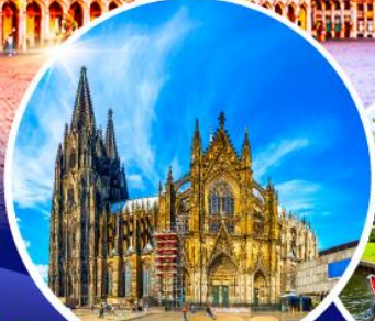
มหาวิหารแห่งโคโลญ หมู่บ้านทึร์ซัน