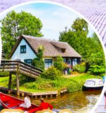
หมู่บ้านกีร์ชุน