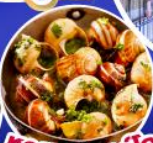
หอยเอสคาร์โก