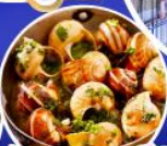
หอยเอสคาร์โก