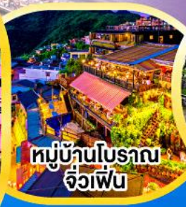
หมู่บ้านโบราณ จิวเฟิน