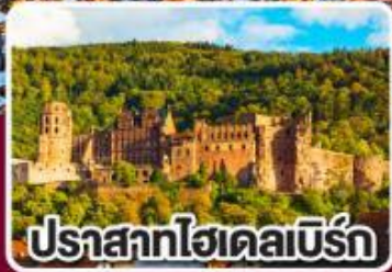
ปราสาทไฮเดลเบิร์ก