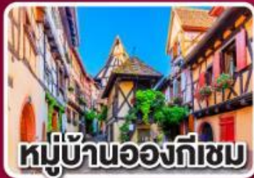
หมู่บ้านอองทีซม