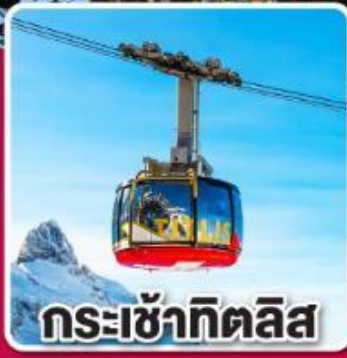
กระเช้าทิตลิส

"ทิกิเซ" เมืองแห่งนาฬิกาทุกคู่ และ ต้นกำเนิดเค้กแบล็กฟอเรสต์