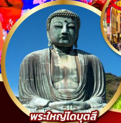
พระใหญ่ไดบุตสึ