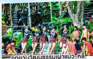
อุทยานวัฒนธรรมเผ่าแม้ว-หลี