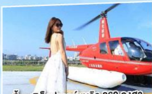
ขึ้นเฮลิคอปเตอร์ชมวิว 360 องศา