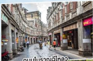
ถนนโบราณไหหลำ