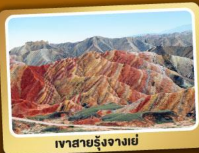
เวาสายรุ้งจางเย่