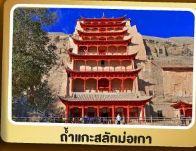
กำแพงสะลักม่อเกา