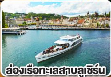
ล่องเรือทะเลสาบลูซิิร์น