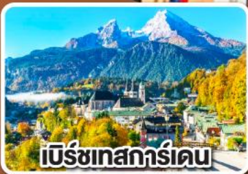
เบิร์ชเทสการ์ดเดน

เข้าชมเมืองเกลือโบราณ แห่งเมืองเบิร์ชเทสการ์ดเดน