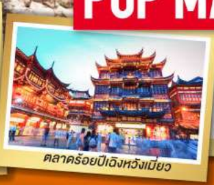
ตลาดร้อยปีเจิ้งหวงเมี่ยว