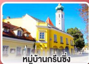
หมู่บ้านกรีนซิง