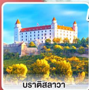
บราติสลาวา

เยือนหมู่บ้านกรีนซิง แห่งออสเตรีย พร้อมอาหารค่ำแบบ “ฮอยริเก้”และไวน์สด