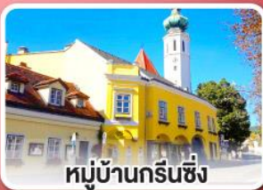
หมู่บ้านกรีนซิง