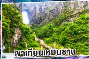
เขาเทียนเหมินซาน