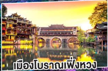
เมืองโบราณเฟิ่งหวง