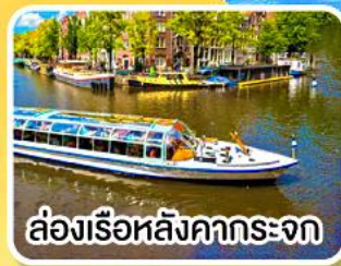
ล่องเรือหลังคากระจก

พิเศษ!! เมนูหอยแมลงภู่อบไวน์ขาว ล่องเรือหมู่บ้านไรถนน ที่รูร์น