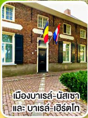
เมืองบารล-นัสซา และ บารล-เฮิร์ตโก