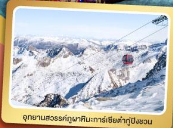
อุทยานสวรรค์ภูผาหิมะการเซียตำกูปิงชวน