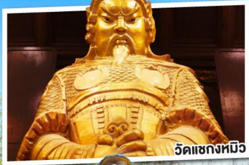
วัดชองหิว