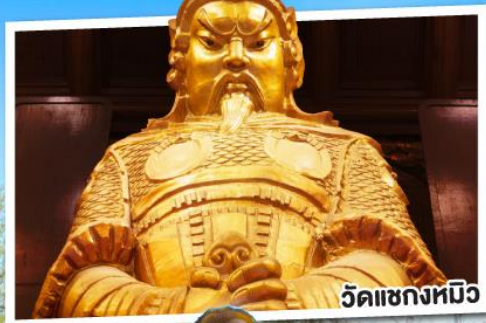
วัดชองหิว