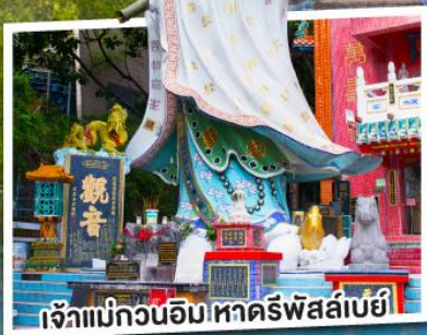
เจ๊แม่กวนอิม ทัศนีย์พลาซ่า