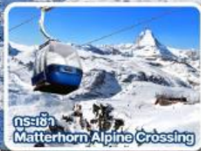
กระเช้า Matterhorn Alpine Crossing