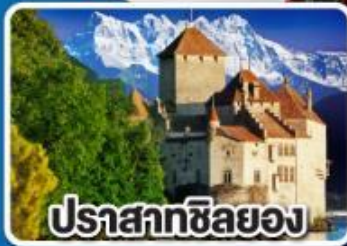
ปราสาทชิลยอง