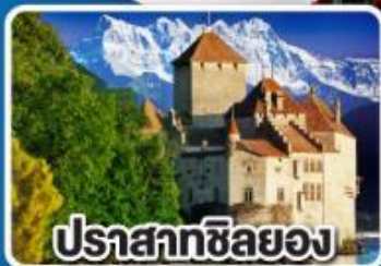
ปราสาทชิลยอง