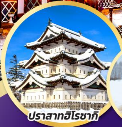
ปราสาทอิโรซากิ