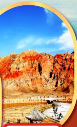
หุบเขาห้าสี อุทยานธรณีกุ้ยเต๋อ