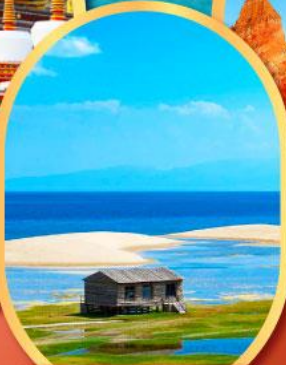
ทะเลสาบชิงไห่