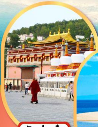
วัดท่าอ้อ